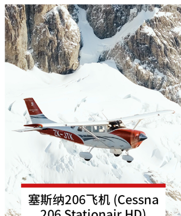
塞斯纳206飞机 (Cessna 206 Stationair HD) 飞机数量 1 乘客数量 5