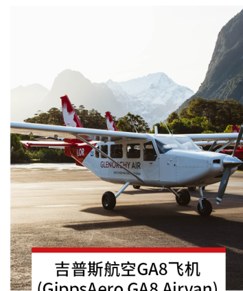
吉普斯航空GA8飞机 (GippsAero GA8 Airvan) 飞机数量 1 乘客数量 7