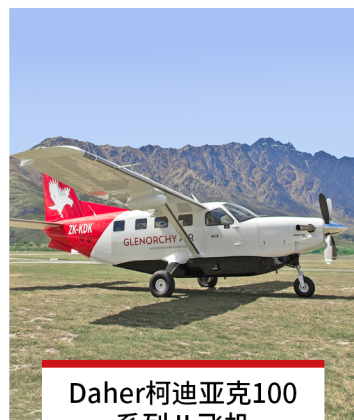
Daher柯迪亚克100系列 II 飞机 飞机数量 1 乘客数量 9