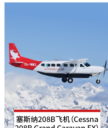
塞斯纳208B飞机 (Cessna 208B Grand Caravan EX) 飞机数量 2 乘客数量 13